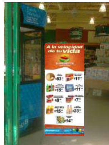
CAJAS POSTER DOBLE CARTA COLLAGE