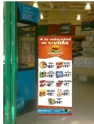
CAJAS POSTER DOBLE CARTA COLLAGE