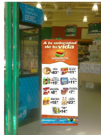
CAJAS POSTER DOBLE CARTA COLLAGE