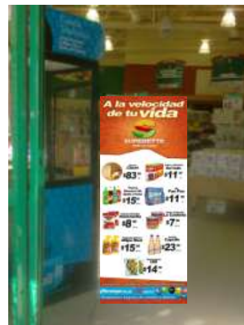
CAJAS POSTER DOBLE CARTA COLLAGE