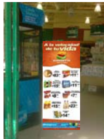
CAJAS POSTER DOBLE CARTA COLLAGE