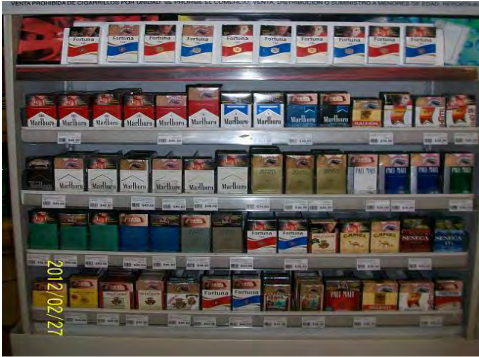
Planograma Exhibidor 3 pies