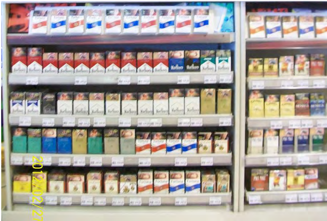
Planograma Exhibidor 4 pies