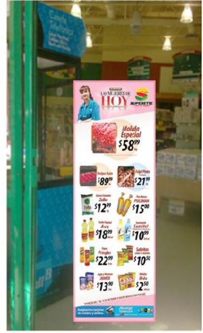
POSTER SEMANAL (LUCHOFERTAS)