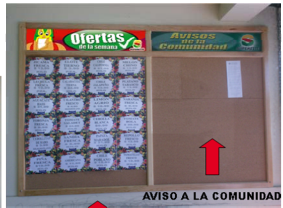
OFERTAS DE LA SEMANA