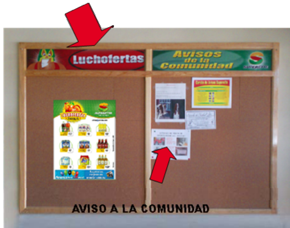
LUCHOFERTAS DE LA SEMANA