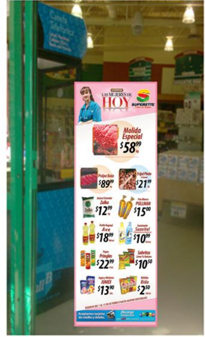
POSTER SEMANAL (LUCHOFERTAS)