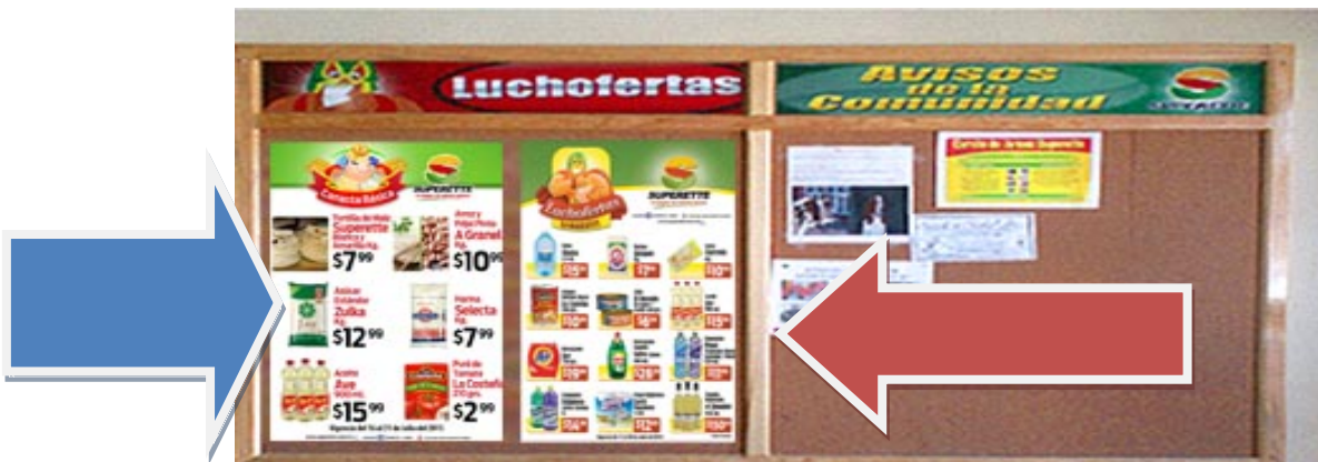
POSTER CANASTA BASICA (FLECHA AZUL) POSTER EXHIBICIONES SEMANALES (FLECHA ROJA)

Se les entregara en sucursal un Poster medida cuatro cartas el cual deberá ser colocado en el pizarrón de de ofertas de la semana de cada una de sus tiendas