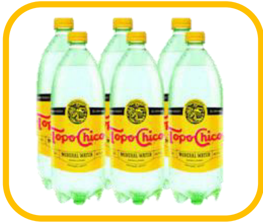
Agua Mineral 1.5 lts ( 6 )