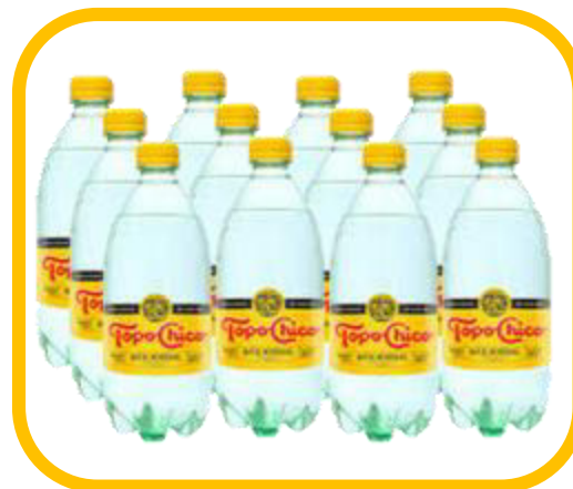
Agua Mineral 600ml (12 )