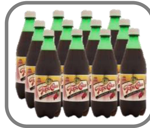
Sangría Regular 600ml (12 )