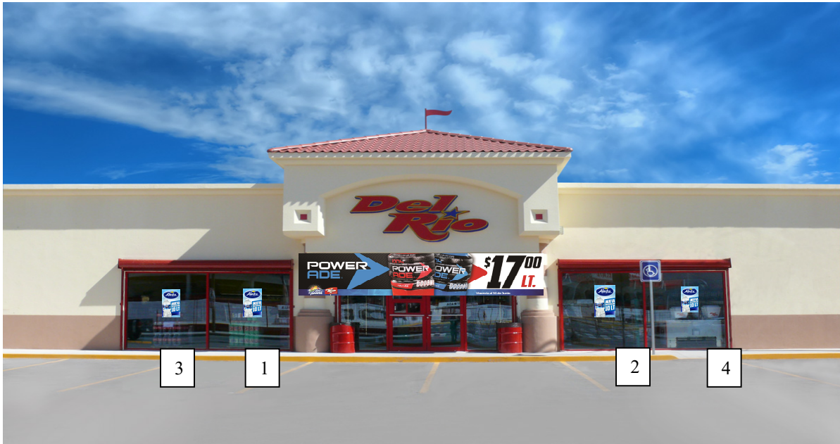
UBICACIÓN DE POSTERS