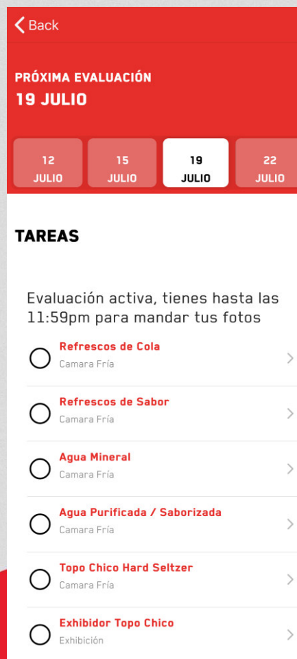
foto evaluaciones a la semana